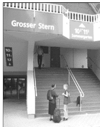
Entrance Grosser Stern (GS)

Le centre de messagerie en ligne est sponsorisé par le ministère fédéral de l'Éducation et de la Recherche.