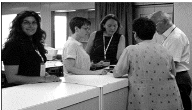
Le bureau de vote en action