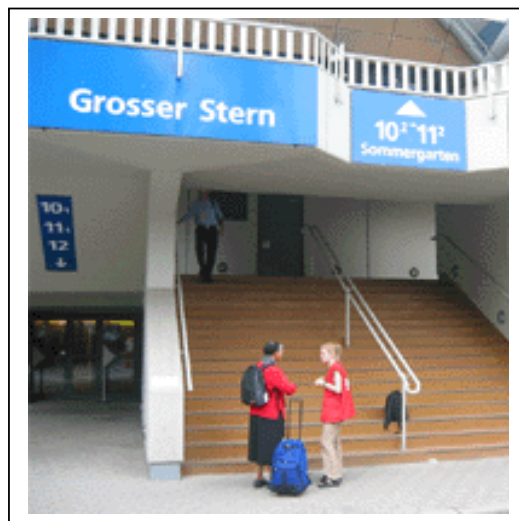
Entrada Grosser Stern (GS)

El centro de mensajes electrónicos está patrocinado por el Ministerio Federal de Educación e Investigación.