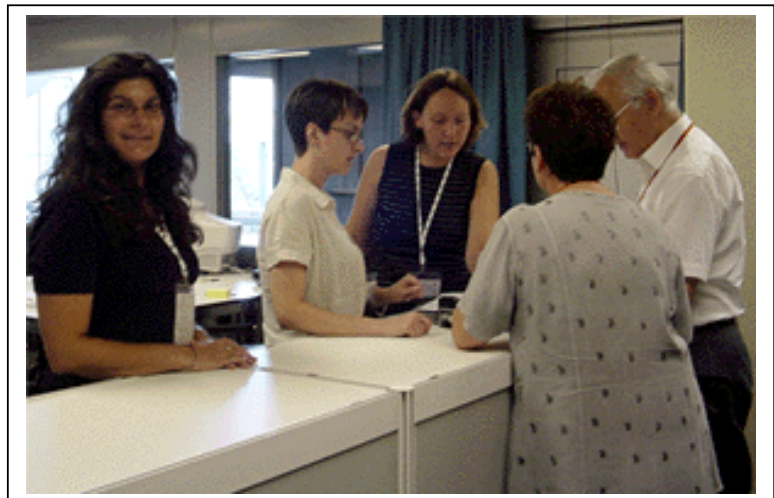
La Oficina Electoral en acción