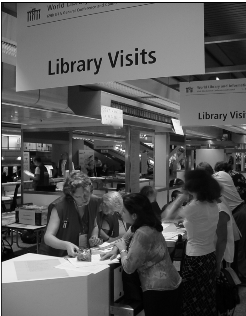
Le comptoir d'inscription : votre porte d'accès vers les bibliothèques de Berlin

Vous trouverez encore des dépliants sur des visites individuelles ou en petits groupes, à la demande. Veuillez vous adresser au comptoir des visites de bibliothèques, dans l'espace consacré aux inscriptions.