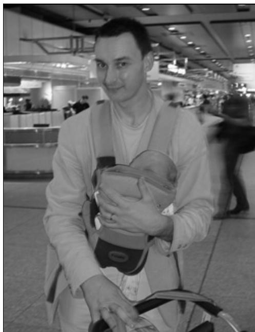
Notre plus jeune participant : 2 mois !

M. Seragaldin, qui devait s'exprimer lors de la session 110 sur les constructions et l'équipement des bibliothèques, ne peut malheureusement se rendre au congrès. Les participants sont invités à assister à la session 95 sur les bibliothèques d'Alexandrie, aujourd'hui lundi, à 10h45, en salle 4.