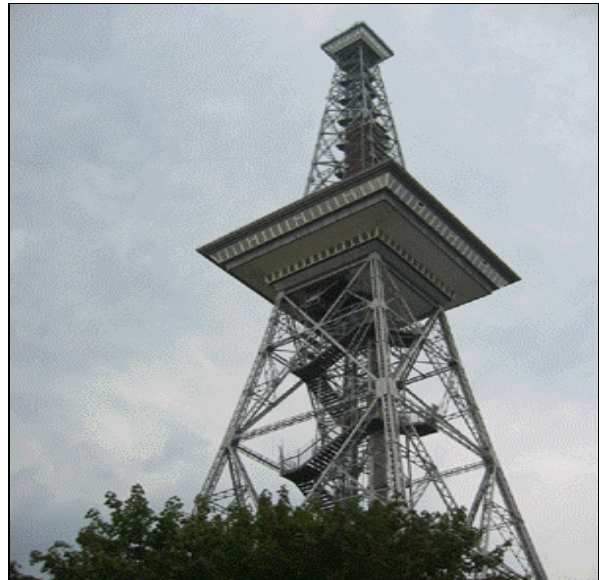
Ce n'est pas la Tour Eiffel!

L'INIST (Institut National de l'Information Scientifique et Technique), hôte de l'IFLANET, est l'une des multiples institutions françaises représentées cette année dans l'exposition. Les autres bibliothèques et institutions de l'enseignement supérieur et de la recherche partageant le stand M7 avec l'INIST sont l'ENSSIB (Ecole Nationale des Sciences de l'Information et des Bibliothèques) et l'ABES (Agence Bibliographique de l'Enseignement Supérieur), qui héberge le catalogue collectif SUDOC (Service universitaire de documentation). Le ministère de la Culture et de la communication (Direction du Livre et de la Lecture) et la Bibliothèque publique d'information (Bpi) sont représentés sur le stand H38/H40 aux côtés de bibliothèques municipales et de bibliothèques départementales de prêt ; vous trouverez la Bibliothèque nationale de France sur le stand H32/H33.