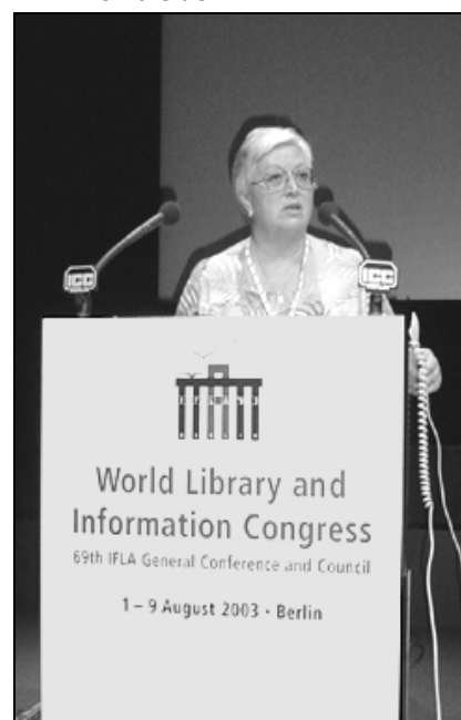
August 2003

Investissez-vous : devenez membre de l'IFLA !