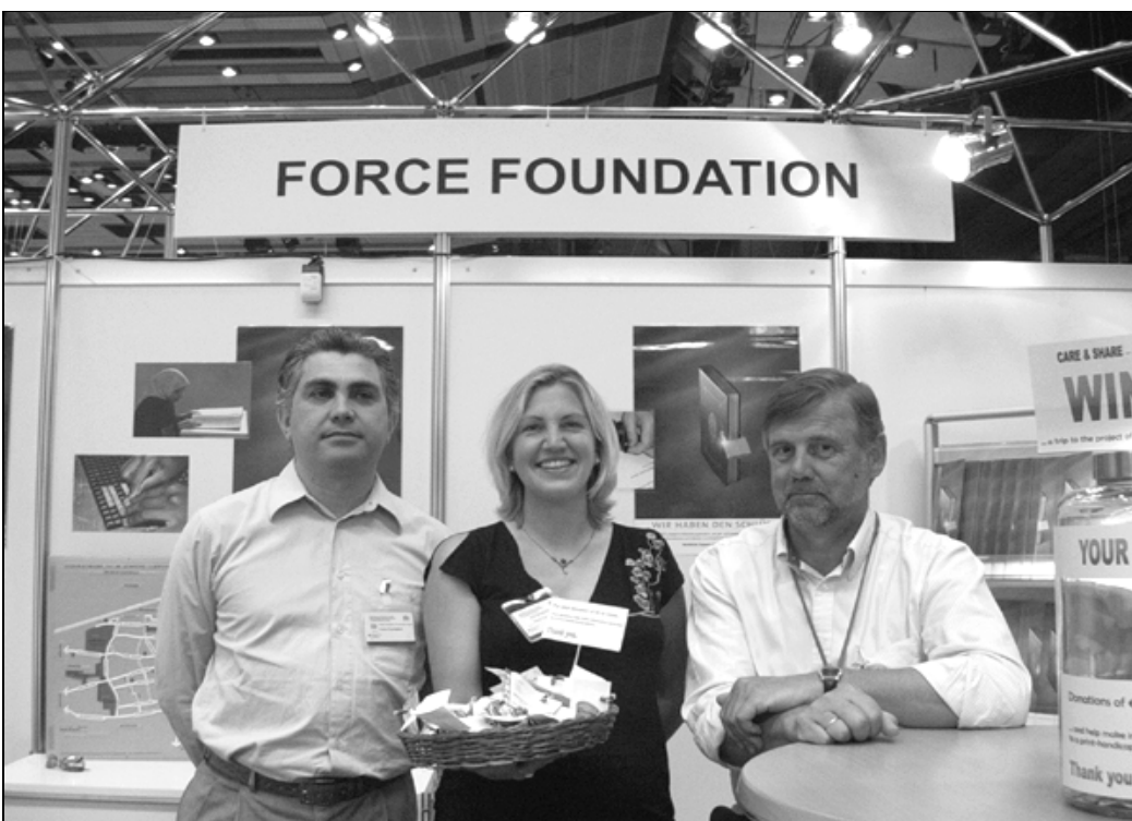
Image de l'exposition

N'oubliez pas de consulter vos messages aux kiosques de messagerie électronique grâce à votre badge, faute de quoi vous risqueriez de passer à côté de gens cherchant à vous joindre ou d'annonces importantes !