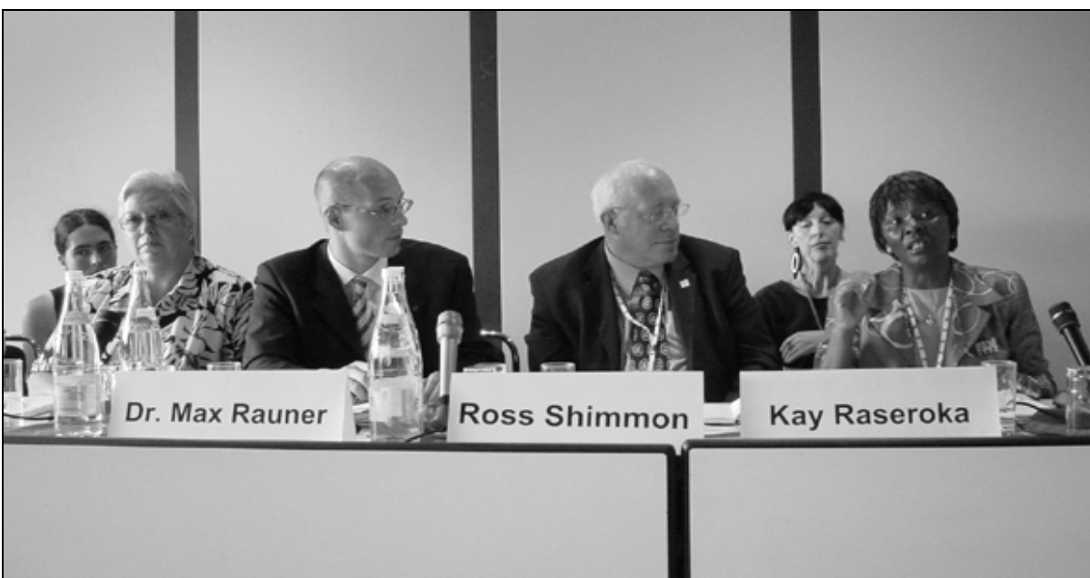
Conférence de presse du lundi

D'autres initiatives ont eu lieu, mais l'information ne nous en est pas parvenue à temps pour ce numéro de l' IFLA Express .