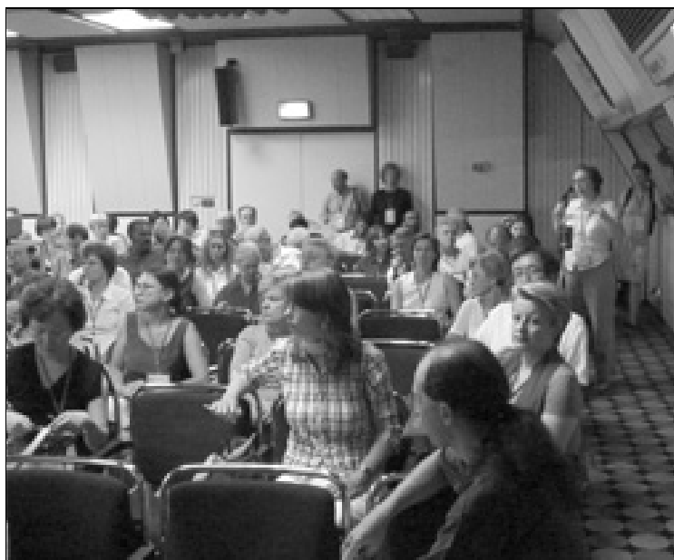
Séance sur la gestion de la connaissance

Pour savoir comment devenir partenaire de l'IFLA, contactez Kelly Moore: kelly.moore@ifla.org