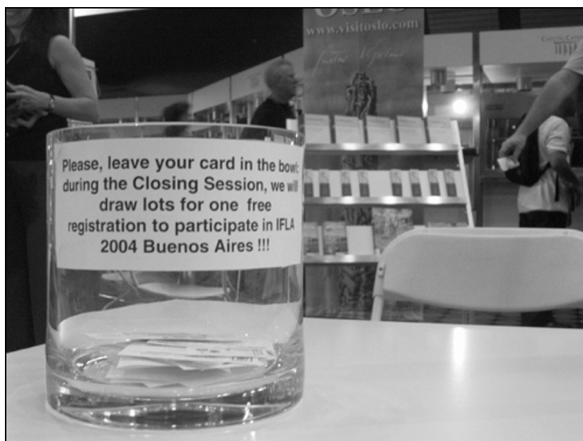
Urna para Buenos Aires

Para obtener más información, visite el stand de la Bundesvereinigung Deutscher Bibliotheksverbände, BDB (Unión Federal de Asociaciones Alemanas de Bibliotecarios), Área C, stand C 10