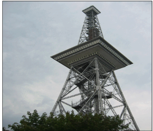
¡No es la Torre Eiffel!

El "Ministère de la culture et de la communication", "Direction du livre et de la lecture y la Bibliothèque publique d'information" (BPI) están representados en el stand H38/H40 junto con las "bibliothèques municipales y bibliothèques départementales de prêt", aunque la "Bibliothèque nationale de France" (BnF) se encuentra en el stand H32/H33.