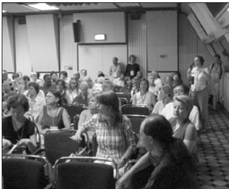
Reunión sobre Gestión del Conocimiento