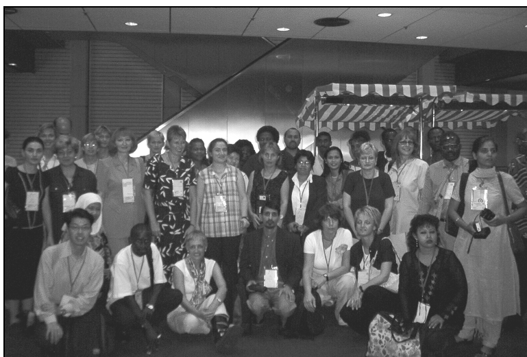
Los becarios del 2003

La reunión sirvió para que hicieran amistad con otras personas y recibieron consejos prácticos para su estancia en Berlín. Se hicieron muchas fotografías de recuerdo, que sin duda se incluirán en los informes sobre el congreso de la IFLA de vuelta a sus países.