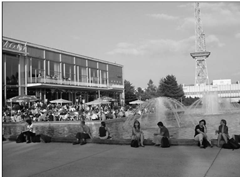
Fiesta de apertura