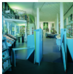
Stuttgart, biblioteca municipal (sección música)