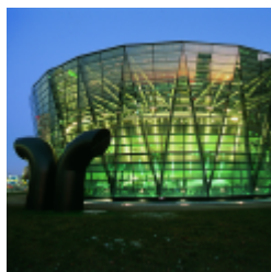
Dortmund, biblioteca municipal y regional

La Bundesvereinigung Deutscher Bibliotheksverbände e.V. - BDB (Asociación Federal Alemana de Asociaciones de Bibliotecarios) situada en Berlín, es la articulación principal de una asociación que representa los intereses de aquellas asociaciones e instituciones relacionadas con el mundo bibliotecario. Entre sus miembros están: Deutscher Bibliotheksverband e.V. - DBV (Asociación Alemana de Bibliotecarios), Berufsverband