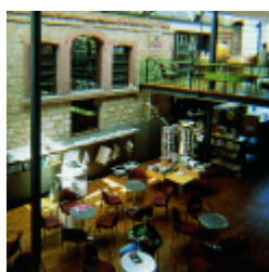
Landau, biblioteca municipal

Las bibliotecas se están enfrentando al reto de proporcionar información, medios y servicios para la era moderna, y ya ha pasado mucho tiempo desde que sólo contaban con libros y revistas. Ahora también hay juegos, CD-Roms, películas, DVDs, libros de audio y cualquier otro soporte. La capacidad para leer y tomar parte en el aprendizaje, ser competente en el uso de medios y las habilidades técnicas para saber investigar y reconocer de forma crítica la información son técnicas culturales básicas. Todos las necesitamos urgentemente para ser capaces de enfrentarnos a la escuela, formación, trabajo y al mundo cotidianos.