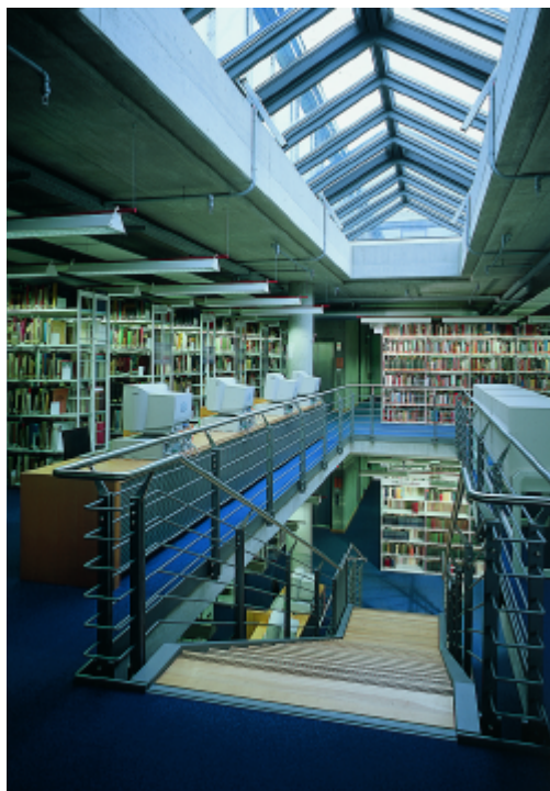
Munich, biblioteca universitaria

Cosas que solían llevar semanas de trabajo se hacen ahora en un momento, gracias a la electrónica: a través de los préstamos interbibliotecarios alemanes y varios servicios de suministro de documentos, uno puede pedir, en papel o formato electrónico, prácticamente cualquier publicación que deseemos y no esté disponible en nuestra biblioteca local. Una red de seis oficinas centrales coordina el préstamo interbibliotecario, recoge y almacena todos los datos relacionados con los fondos de las bibliotecas universitarias y los hace públicos a través de internet en forma de "catálogo virtual".