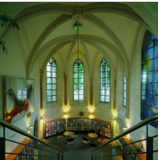
Halberstadt, biblioteca municipal

En Alemania hay aproximadamente 10.200 bibliotecas públicas y 4.000 universitarias. Están financiadas y mantenidas por las administraciones municipales y el Federal Länder (Estado Federal), así como por la Iglesia y fundaciones e instituciones privadas. La descentralización está teniendo un marcado efecto en el sistema bibliotecario (a diferencia de otros países, no hay leyes sobre bibliotecas en Alemania, ni una administración central por parte del estado ni ninguna institución privada). Esta situación es producto de razones históricas, ya que la responsabilidad en asuntos culturales, académicos, artísticos y educativos siempre ha recaído en el Estado. Las administraciones municipales también comparten esta soberanía cultural, sus competencias voluntarias incluyen actividades como el mantenimiento de teatros, museos y bibliotecas.