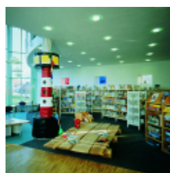
Westerstede, biblioteca municipal